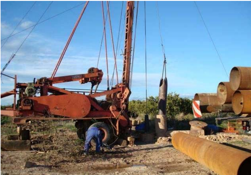
Trabajos de adecuación de infraestructuras en el Parque