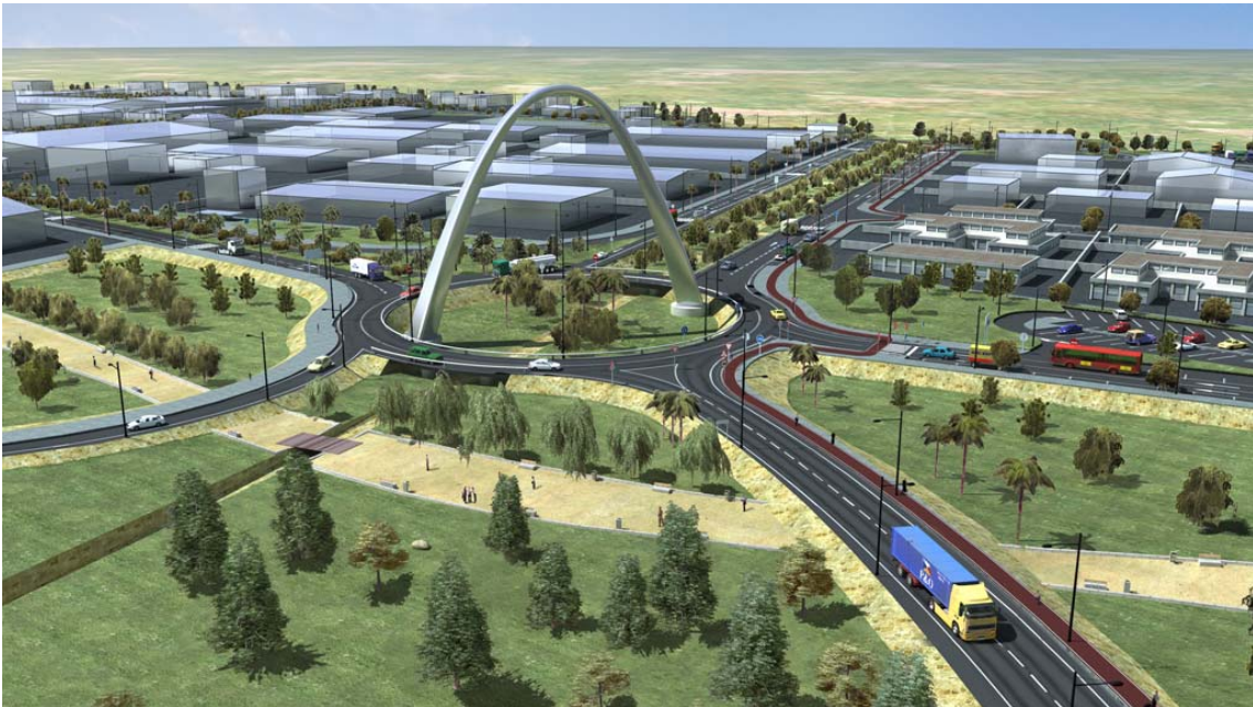
Representación en 3D del Parque Empresarial El Pla