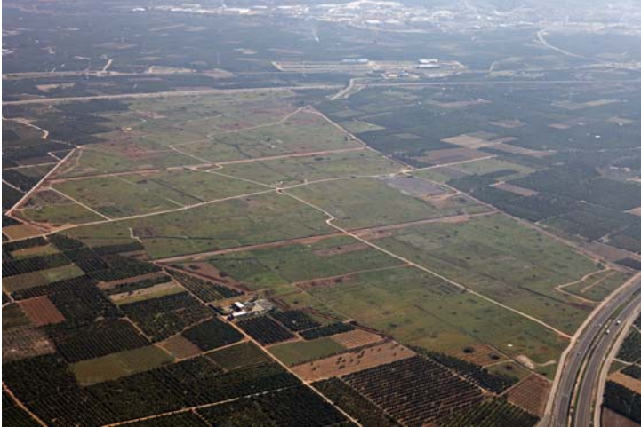
Vista aérea de la superficie del Parque