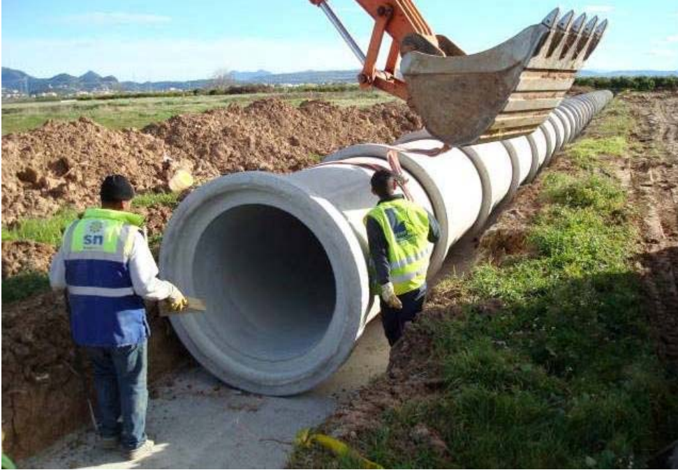
Trabajos de desvío y canalización de las acequias